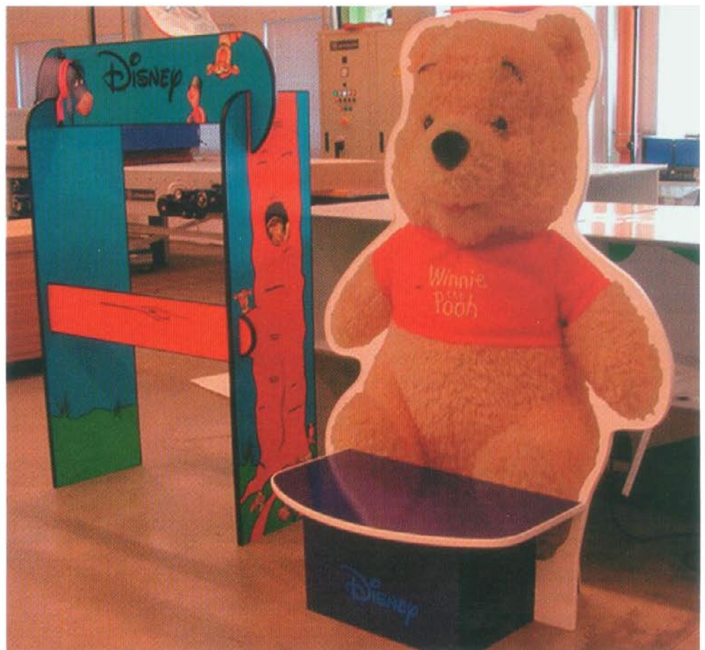
Προωθητικά υλικά για την Disney με υλικό Re-board, ιδανικό για «φωτεινές» εκτυπώσεις και εντυπωσιακές κατασκευές.

εσωτερικό κυψελωτό στρώμα από χαρτόνι, εντυπωσιακά μεγάλης σκληρότητας και ανθεκτικότητας, καλυμμένο από ειδικό λευκό εκτυπώσιμο γυαλιστερό χαρτί μεγάλης αντοχής στη μηχανική καταπόνηση, που δεν επηρεάζεται από την υγρασία. Εκτυπώνεται, κόβεται, είναι οικολογικό και ανακυκλώσιμο και διατίθεται σε πάχη που ξεκινούν από 6 χιλιοστά και φτάνουν μέχρι 10 εκατοστά. Η ιδιαιτερότητα αλλά και το μεγάλο πλεονέκτημά του είναι ο συνδυασμός του